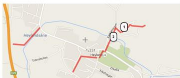
Pansersperringen på Høyland

Oversiktskart over pansersperringen i Sandnes kommune. Rødt betyr at sperringen ble bygget som mur, mens blått er at den ble bygget som en grøft. Lilla betyr at det var en kombinasjon mellom disse. De tomme områdene er steder der sperringen ikke ble bygget. Noen steder er dette fordi det fantes naturlige sperringer, som myrområder. Andre steder ble ikke muren ferdig før krigen ble avsluttet. Tallene, som går opp til 16, er referanser til deler av sperringen som eksisterer i dag. Krigsminnene nedenfor har referanser til kartet.