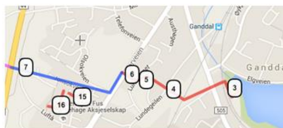
Pansersperringen fra Stokkalandsvatnet til R44