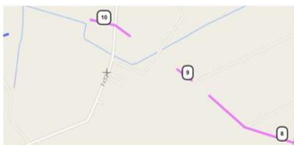
Pansersperringen fra R44 til Todneim