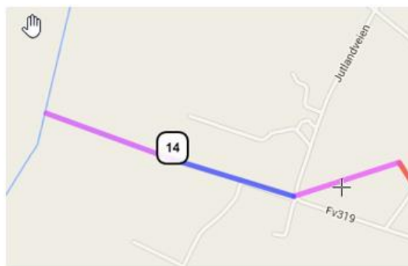
Pansersperringen ved Heigre til kommunegrensen