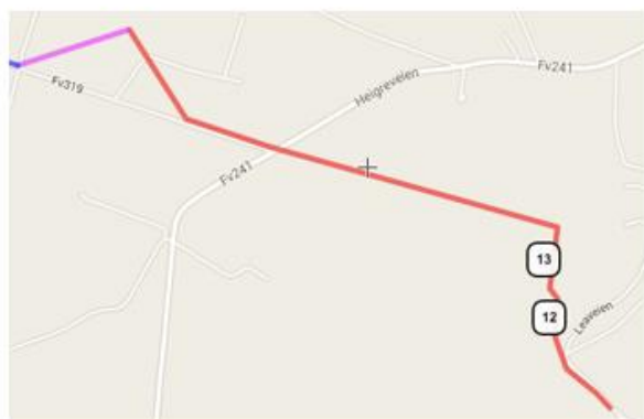
Pansersperringen ved fra Leanuten til Heigre